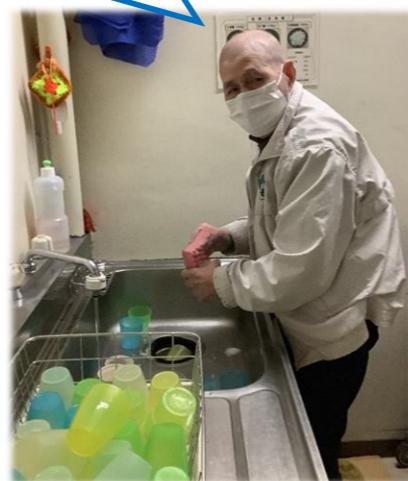
コップ洗いは任せてね～