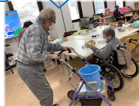
ぬか漬けたよ 材料を 買って 手巻き 寿司