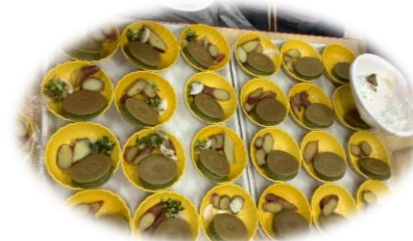
「おやつ時間に いただきました。」