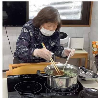
美味 しく な あ れ ♪