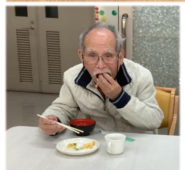
美味 しい よ く ♪