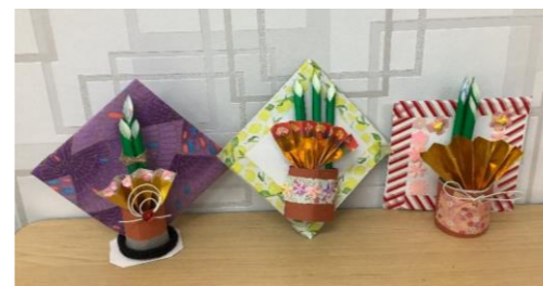
門松を作りました

2025年新たな一年がスタートしました！今年はどうな一年にしましょうか・・・デイサービスほほえみでは、担当のケアマネジャーさんへ年賀状を書き、一年の幸せを願いながら「門松作り」も行い、幸先のいいスタートを切ることができました。寒い日々ではありますが、体調を崩さないように、デイサービスで、「体力作り」を続けていきましょう。