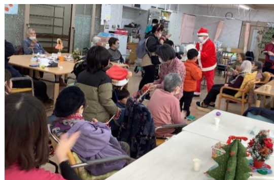
音楽に合わせて、楽器を鳴らしたり・・・♪