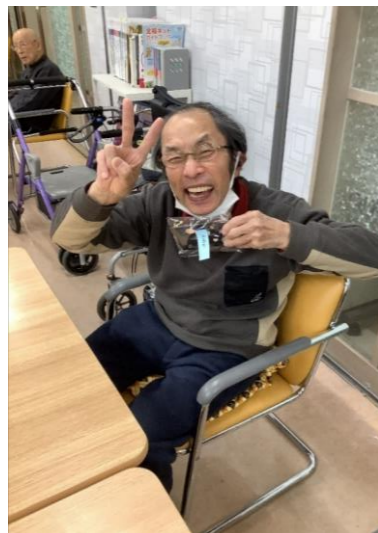
ゴールしたよ♪イエイ