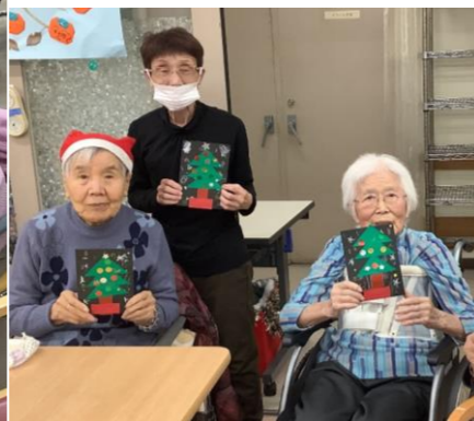
最後にプレゼントの交換をしました。デイサービスからこどもたちへ、こどもたちからデイサービスへ、サンタさんから贈り物がありました。元気いっぱいのこどもたちにパワーをもらいましたね(^^)