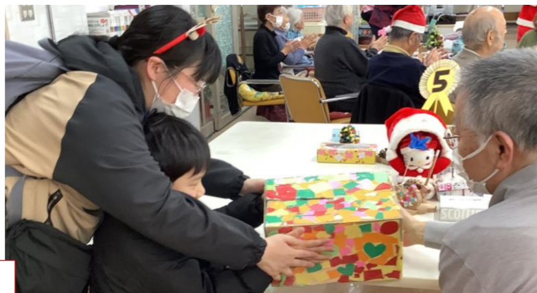
一緒にゲームをしたり・・・♪