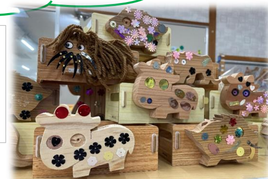
素敵な作品が仕上がってきています

今年の敬老の日は、ご自身で小物入れの箱を組み立て・飾りつけたものを、お持ち帰りいただきます。 個性豊かな作品が出来上がってきていますので、お楽しみに・・・★